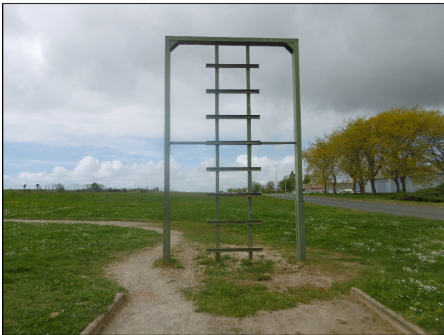
Obstacle n°08: Etat Actuel